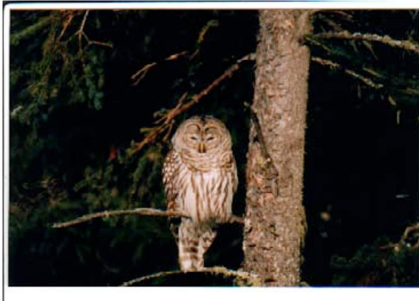
Chouette rayée, février 2002 à Douglastown